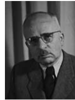
פליקס רוזנבליט (פנחס רוזן) שר המשפטים