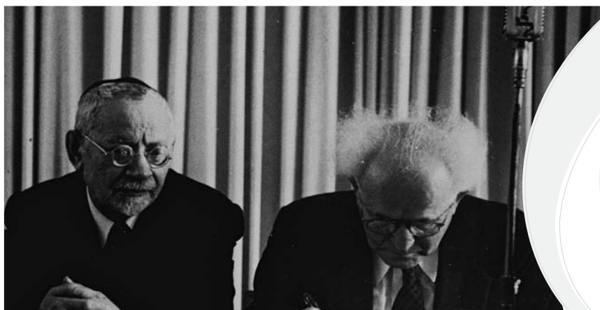
דוד בן גוריון ורבי יהודה לייב הכהן (משמאלו) חותמים על מגילת העצמאות