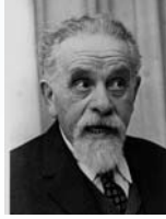
יצחק גרינבוים שר הפנים