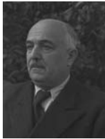
דוד רמז שר התחבורה