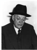
יהודה לייב הכהן מימון שר הדתות ונפגעי המלחמה