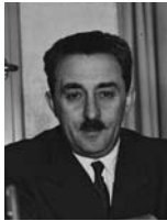
משה שרתוק שר החוץ