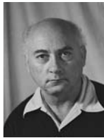
אהרון ציזלינג שר החקלאות