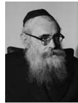
יצחק מאיר לזין שר הסעד