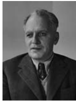
בכור שלום שטרית שר המשטרה והמיעוטים