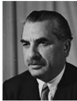
משה שפירא שר העלייה והבריאות