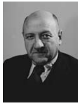
אליעזר קפלן שר האוצר