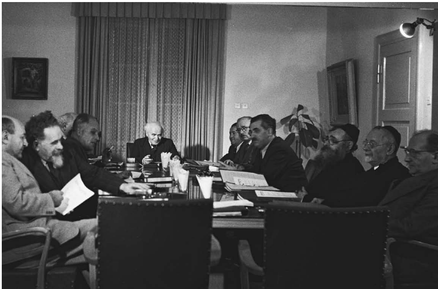
שרי הממשלה הזמנית בראשותו של דוד בן גוריון בפתח ישיבת הממשלה

ה' אייר תש"ח 14.5.1948 - ט' אדר תש"ט 10.3.1949