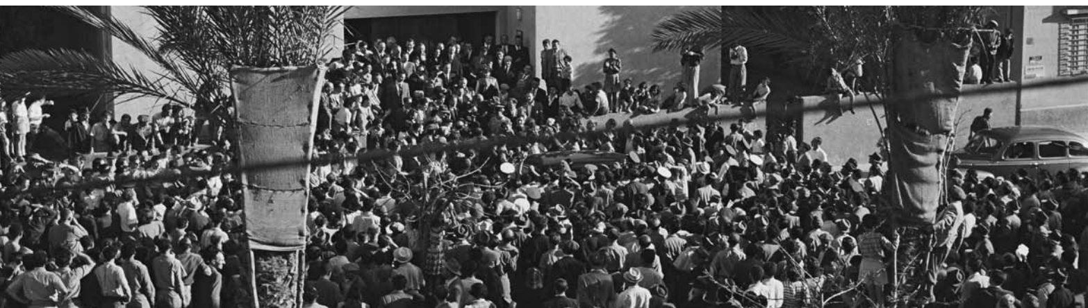
אזרחים מתקהלים בפתחו של מוזיאון תל אביב וממתנינים להכרזת העצמאות