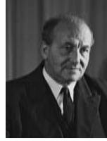
פרץ ברנשטיין שר המסחר, התעשייה והאספקה