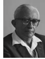
מרדכי בנטוב שר העבודה והבינוי